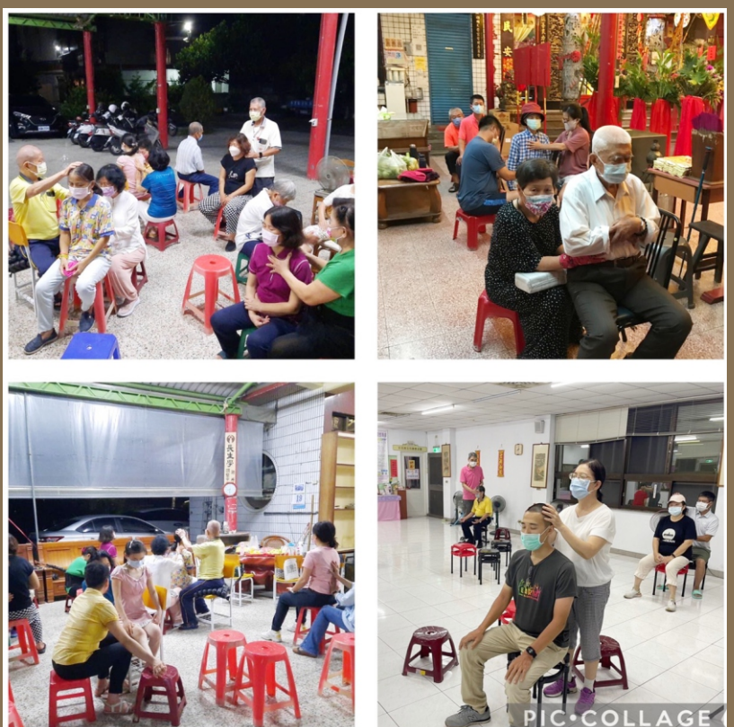
高屏地區新興、清淨堂、天營宮三個調整站，在疫情期間仍無休的調整，感恩義工們無畏的付出！